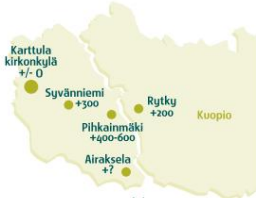
Ote Karttulan ja Kuopion kuntaliitoksen vaikutavuusselvityksestä

Syvänniemen kylä on maakuntakaavan kehitettäviä kyliä. Maankäytössä pyritään kehittämään erityisesti tieakselia Karttula-Kuopio. Pihkainmäen ja Syvänniemen vetovoimaisuus kasvaa, kun uudet merkittävät yritys- ja palvelualueet valmistuvat Pitkälähteen, Pienen Neulamäkeen ja Matkukseen. Asukasluvun osalta Syvänniemen lisäyksen arvioidaan olevan + 300 henkeä